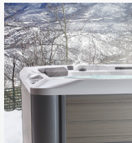
FiberCor® Hoge dichtheid Isolatie